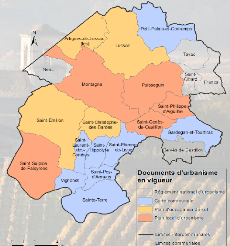
Les documents d'urbanisme de la Communauté de communes du Grand Saint-Emilionnais

Source : Fond de carte IGN© 2010 ; BD Topo : Pays du Libournais Réalisation : C. Fressard, L. Gohier, M. La Gagne, X. Poly, M. Zaragoga, EPU D44 - Avril 2013